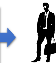
セミナー受講日時に発生する賃金