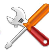
セミナー受講日時に発生する賃金